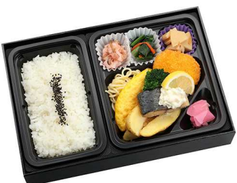
あじの香草焼き膳 (レモン風味) 1,202円

【特定原材料】 小麦 乳 卵 海老 【箱サイズ】 18.5cm×28.5cm×5cm