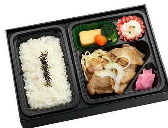
豚のしょうが焼き膳 1,100円

【特定原材料】 小麦 乳 卵 海老 蟹 【箱サイズ】 18.5cm×28.5cm×5cm