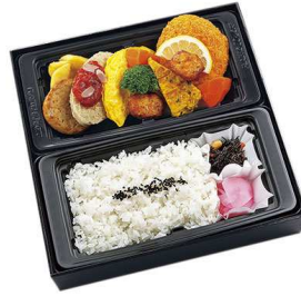
洋風幕の内御膳 1,314円

【特定原材料】 小麦 乳 卵 海老 【箱サイズ】 25.4cm×25.2cm×5cm