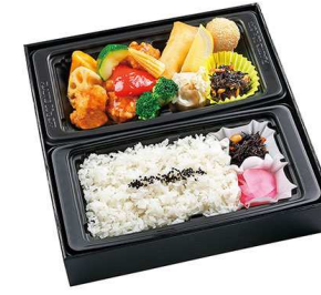
中華幕の内御膳 1,314円

【特定原材料】 小麦 乳 卵 海老 蟹 【箱サイズ】 25.4cm×25.2cm×5cm