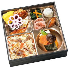
旬彩四枱膳 碧(あおい) 1,721円

【特定原材料】 小麦 乳 卵 海老 蟹 【箱サイズ】 18cm×18cm×4.5cm