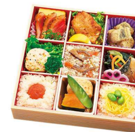
旬彩九枱膳 煌(きらめき) 1,518円

【特定原材料】 小麦 乳 卵 海老 【箱サイズ】 22.5cm×22.5cm×5cm