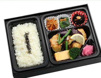
鶏と茄子の生姜 あんかけ膳 1,202円

【特定原材料】 小麦 乳 卵 蟹 【箱サイズ】 18.5cm×28.5cm×5cm