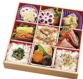
旬彩九枱膳 篋(たかむら) 2,027円

【特定原材料】 小麦 乳 卵 海老 蟹 【箱サイズ】 18cm×18cm×4.5cm