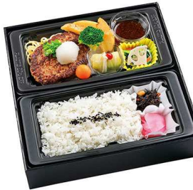
特製BIGハンバーグ 御膳 1,416円

【特定原材料】 小麦 乳 卵 海老 蟹 落花生 【箱サイズ】 25.4cm×25.2cm×5cm