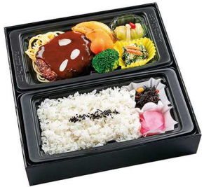
特製ハンバーグ御膳 1,314円

【特定原材料】 小麦 乳 卵 海老 【箱サイズ】 25.4cm×25.2cm×5cm