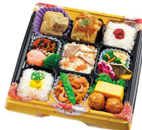
旬彩九枱膳 紅(くれない) 1,212円

【特定原材料】 小麦 乳 卵 海老 【箱サイズ】 22.5cm×22.5cm×5cm