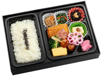
赤魚の塩麴焼き膳 998円

【特定原材料】 小麦 乳 卵 海老 【箱サイズ】 18.5cm×28.5cm×5cm