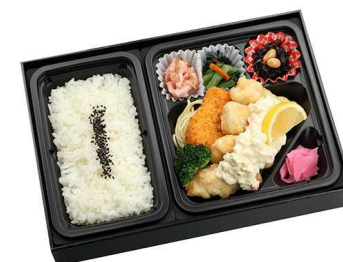
ご当地名物 とり天タルタル膳 1,202円

【特定原材料】 小麦 乳 卵 蟹 【箱サイズ】 18.5cm×28.5cm×5cm