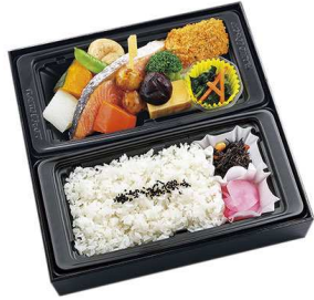
和風幕の内御膳 1,314円

【特定原材料】 小麦 乳 卵 海老 【箱サイズ】 25.4cm×25.2cm×5cm