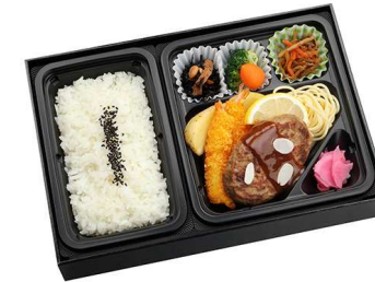
ハンバーグ & 海老フライ膳 1,100円

【特定原材料】 小麦 乳 卵 蟹 【箱サイズ】 18.5cm×28.5cm×5cm